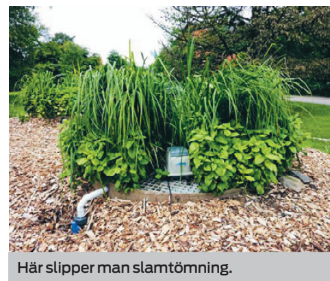
Här slipper man slamtömning.